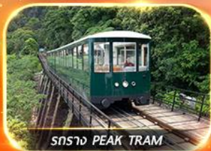
รถราง PEAK TRAM