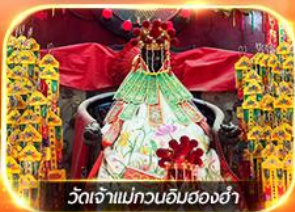
วัดเจ้าแม่ทวนอิมสองฮ่า