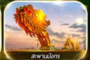
สะพานมังกร

สัมผัสความงามหมู่บ้านฝรั่งเศสที่บานาฮิลล์ ช้อปปิ้ง POPMART