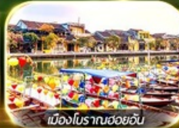
เมืองโบราณฮอยอัน