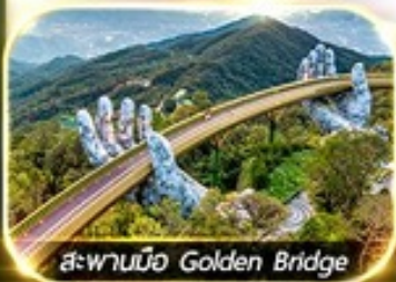
สะพานมือ Golden Bridge