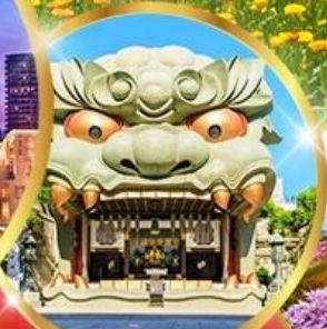
ศาลเจ้านิมมะ ยาชากะ