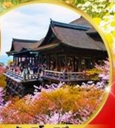
วัดคิโยมิจิ