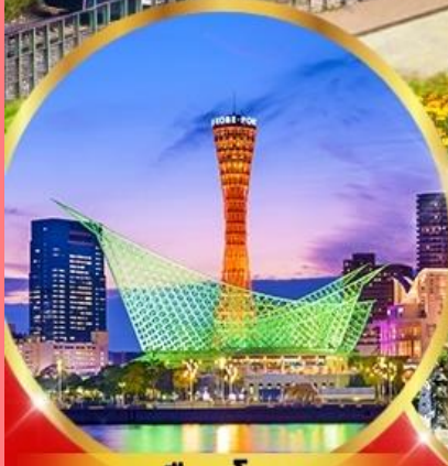
เมืองโกเบ