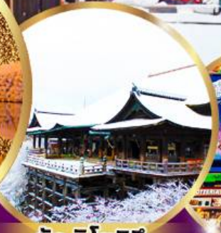
วัด คิโยมิจิ