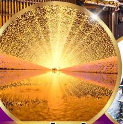
นาบาระ โนะ ซาโตะ