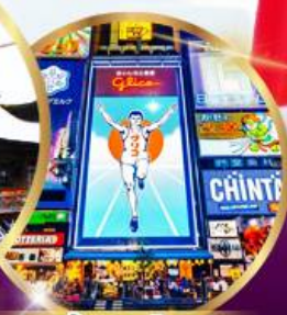
ช้อปปิ้ง ซินโซบาชิ