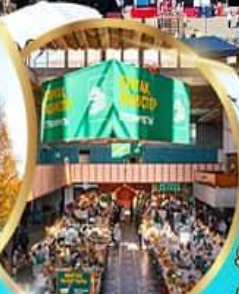
ตลาดกรีนบาร์ชา