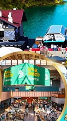
ตลาดกรีนบาร์ชา

ราคา เดียว 49,919 บาท รวมภาษีมูลค่าเพิ่ม 7%