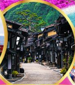
นาราอิซุกุ