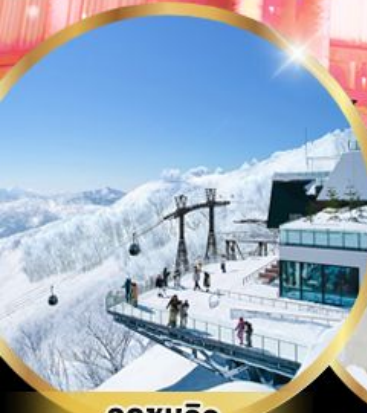
จุดชมวิว Unkai Terrace