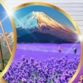
โออิชิ ปาร์ค