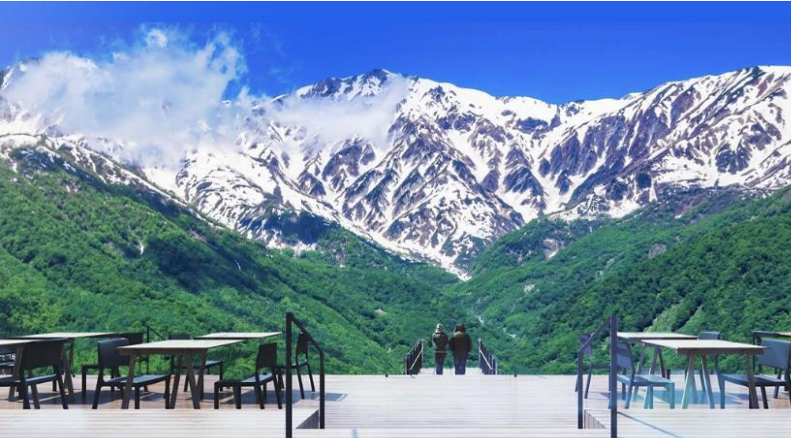
HAKUBA MOUNTAIN HARBOR

ไม่พลาดกับการชมวิวแบบพาโนรามา ณ Hakuba Mountain Harbor ด้วยทัศนียภาพที่เหนือชั้นของภูเขาโดยรอบ จุดเด่น คือ ระเบียง “Hakuba Sanzan” ที่สามารถเห็นเทือกเขาแอลป์แบบ 360 องศา ได้อย่างสวยงามในทุกฤดู สามารถยื่นถ่ายรูป และดื่มด่ำกับบรรยากาศได้อย่างเต็มอิม ในบริเวณเดียวกันยังมีร้านเบเกอรี่ โดยทางเข้ามีที่นั่งบนระเบียง สามารถเพลิดเพลินไปกับการจิบเครื่องดื่มอุ่น ๆ พร้อมชมบรรยากาศตามอัธยาศัย