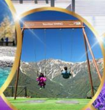
ชิงช้า Yoo hoo! Swing