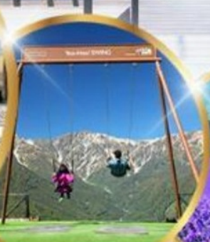
ชิงช้า Yoo hoo! Swing