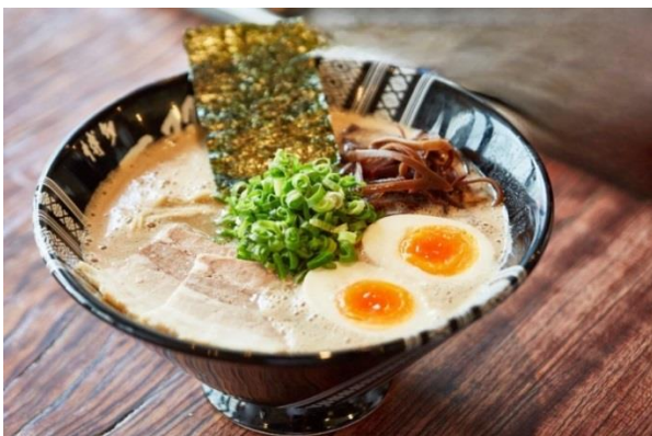
ฮากาตะราเมง (Hakata Ramen)