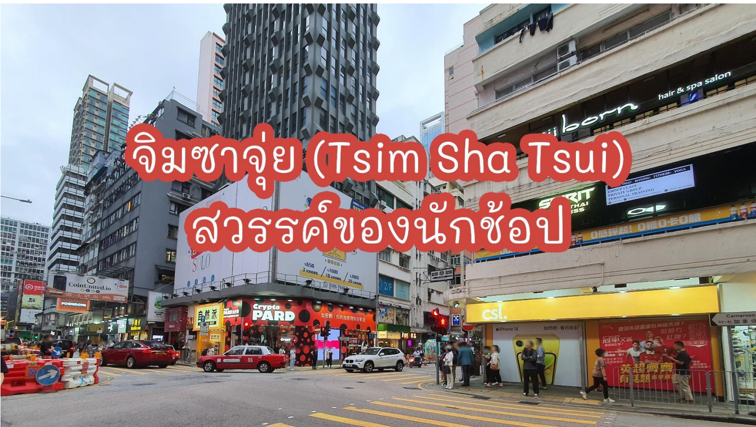
ย่านจิมซาจุ้ย ถนนนาธาน

เป็นแหล่งรวบรวมสินค้าแบรนด์เนมจากทั่วทุกมุมโลก โดยเฉพาะเลือกซื้อสินค้าประเภทต่าง ๆ อย่างเต็มอิมใจ จนกว่าถึงเวลานัด