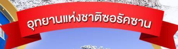
อุทยานแห่งชาติซอรัคซาน