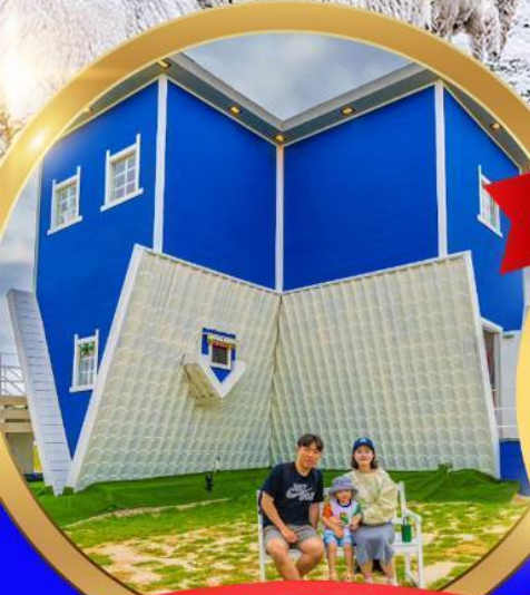
UPSIDE DOWN HOUSE