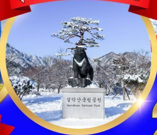
설악산국립공원 Seoraksan National Park