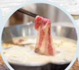
เมนูพิเศษ สุกินหม่าล่า