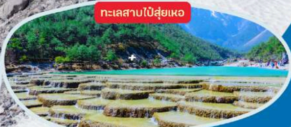
ทะเลสาบไ้ส่วยเหอ