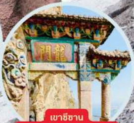
เขาวงกต รวมกระเช้า+รถแบคเตอร์