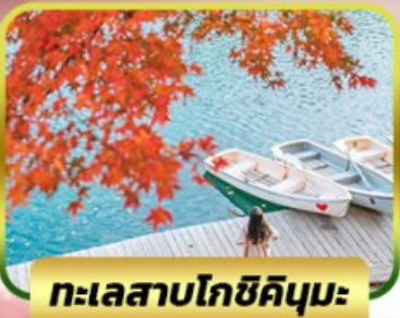
ทะเลสาบโกชิคิคุมะ