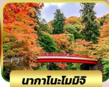
นากาโนะโมมิชิ