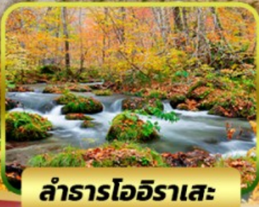
ลำธารโออิราเสะ