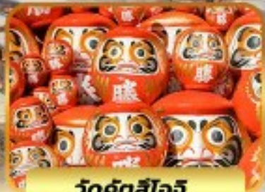
วัดคังตสึโงอิ