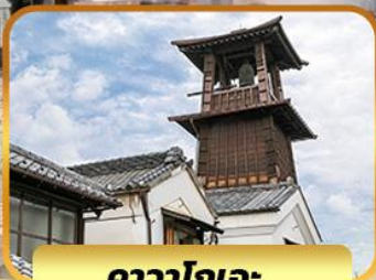
คาวาโกเอะ