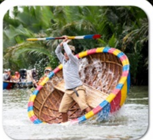
"ล่องเรือกระด้ง"

นั่งกระเช้าที่ยาวที่สุดในโลก ขึ้นสู่บานาฮิลล์ • หมู่บ้านฝรั่งเศส • สวนสนุก FANTASY PARK LE JARDIN D'AMOUR • สะพานมือสีทอง • วัดหลินอึ้ง • เมืองโบราณฮอยอัน หมู่บ้านกิมกาน • ล่องเรือกระด้ง • สะพานมังกร • APEC PARK • ตลาดฮาน