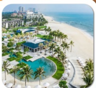
"พัก 5 ดาว HYATT DANANG 2 คืน"