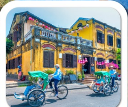
"เมืองโบราณฮอยอัน"

4 วัน 3 คืน วันเดินทาง 21-24 พ.ย. 2567 สายการบิน VIETJET AIR (VZ)