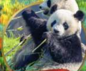
หมี่แพนด้าตู่เจียงเจียง