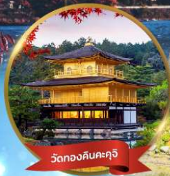
วัดทองคินคะคุจิ