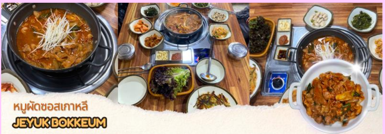
หมูผัดซอสเกาหลี JEYUK BOKKEUM