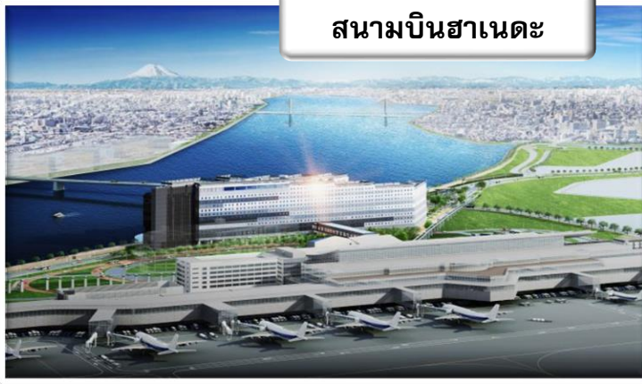
สนามบินฮาเนดะ

เวลา 23.15 น. ออกเดินทางสู่ สนามบินฟูคูโอกะ ประเทศญี่ปุ่น โดย สายการบินไทย เที่ยวบินที่ TG 682