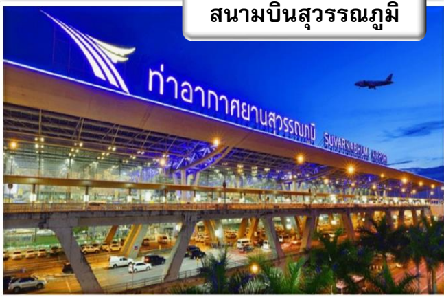
สนามบินสุวรรณภูมิ

เวลา 20.00 น. พร้อมกันที่ ท่าอากาศยานสุวรรณภูมิ อาคารผู้โดยสารขาออกระหว่างประเทศ เคาน์เตอร์สายการบินไทย เจ้าหน้าที่คอยให้การต้อนรับ ดูแลด้านเอกสาร เช็คอิน และสัมภาระในการเดินทาง