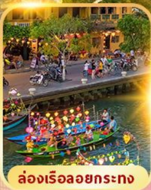
ล่องเรือลอยกระทง