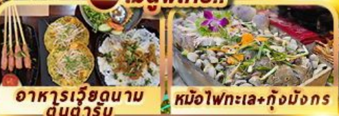
อาหารเวียดนาม ดนตรี หม้อไฟทะเล+กุ้งมังกร