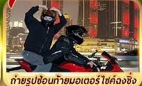
OPTION!! ถ่ายรูปขี่มอเตอร์ไซด์ลงซิ่ง