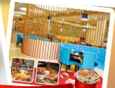
ก๊วยแม่น้ำ + HOTPOT SEAFOOD