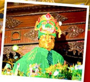
ขอพรแม่ย่ากษัตริย์