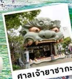
ศาลเจ้ายาซากะ

✓ 🏠 ที่พักในเมือง 1 คืน ใกล้ย่านช้อปปิ้ง