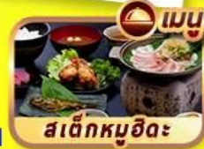
สเต็กหมูฮิดะ