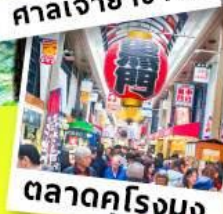
ตลาดคุโรมง

เที่ยว คามิโคจิ สวิตเซอร์แลนด์แดนญี่ปุ่น สัมผัสความงามราวอัญมณีท่ามกลางหุบเขา