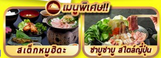
เมนูพิเศษ!! สเด็กหมูฮิดะ ซาซุซาบู สโตล์ญี่ปุ่น