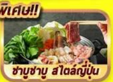
ชาบูชาบู สโตนญี่ปุ่น