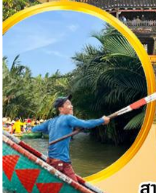
นั่งเรือกระดังง์