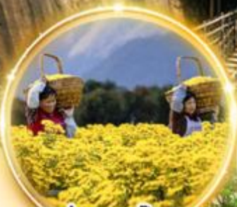
ชมทุ่งดอกเก๊กฮวย สีเหลืองสดใส