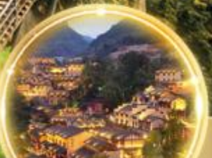
ดื่มด่ำบรรยากาศสุดพิเศษ พร้อมพิทักษ์ในหุบเขา