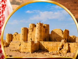
กลุ่มปราสาททะเลทราย (Desert Castles)