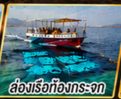
ล่องเรือท้องกระจก