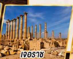
เจอร์ราช