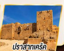
ปราสาทครีค