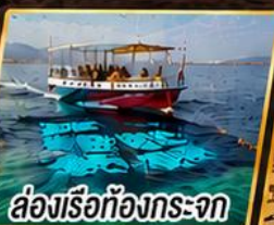
ล่องเรือท้องกระจก