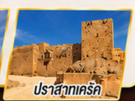
ปราสาทเคร็ค