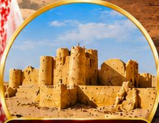
กลุ่มปราสาททะเลทราย (Desert Castles)