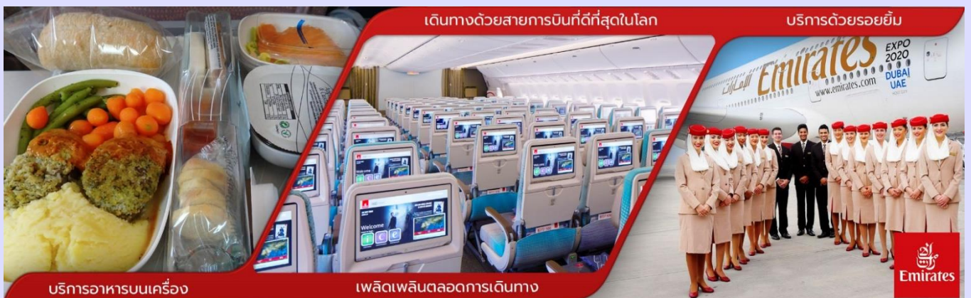
บริการอาหารบนเครื่อง

01.05 ออกเดินทาง สู่สนามบินนานาชาติดูไบ โดยสายการบิน EMIRATES (EK) เที่ยวบินที่ EK385 (บริการอาหารและเครื่องดื่มบนเครื่อง)