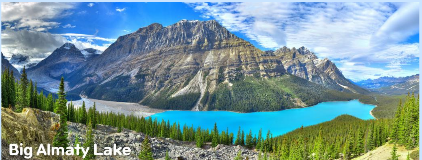
Big Almaty Lake

เช้า รับประทานอาหารเช้า ณ ห้องอาหารโรงแรม