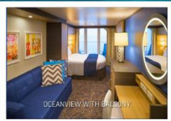
OCEANVIEW WITH BALCONY