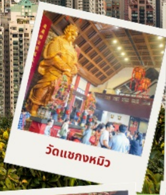
วัดเขangkงหมิว