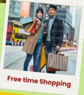
Free time Shopping