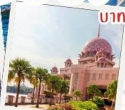
มัสยิดปุตรา