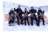
สนุกกับกิจกรรมจับปูยักษ์

00.00 น. ออกเดินทางสู่ เมืองคีร์กเคนส โดยสายการบิน...เที่ยวบินที่... 00.00 น. เดินทางถึงสนามบินเมืองคีร์กเคนส