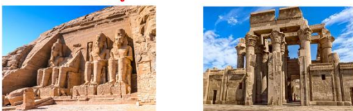
มหาวิหารอาบูซิมเบล วิหารคอมอมโบ

** พักที่ Jaz Crown Prince Cruise 5* หรือเทียบเท่า **