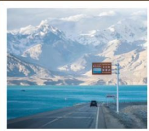
ทะเลสาบไปซาหุ

คิซาร์ · กู่ซอ · อุหลู่มู่ดี พิธีเปิดเมืองเก่า / เมืองโบราณคิซาร์ / มัสยิดอิติการ์ / ถนนคนเดินHandmade โรงน้ำชาอ๋อหยี่ / ทะเลสาบไปซาหุ / ทะเลสาบกาลาคู่เล่อ / ภูเขาหิมะ Muztagh Peak ทะเลทรายทากลามากิน / จุดชมวิวกะแลแดง / แกรนด์แคนยอนเทียนชาน สวนต้นหูหย่าง / สวนหลงชาน / ตลาดต้าปาจา