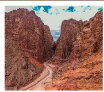
แกรนด์แคนยอนเทียนชาน