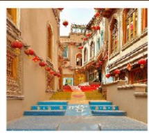
เมืองโบราณคิซาร์