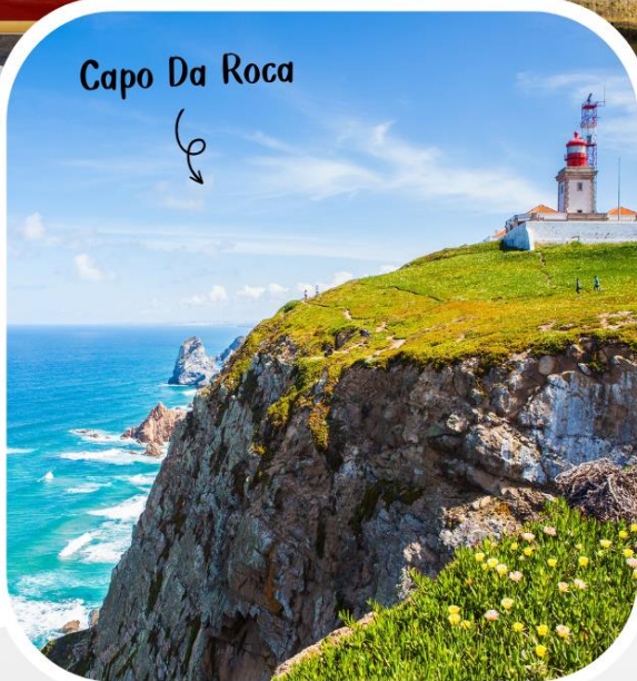
Capo Da Roca