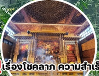
บู เรื่องโชคลาภ ความสำเร็จ Loyang Tua Pek Kong Temple