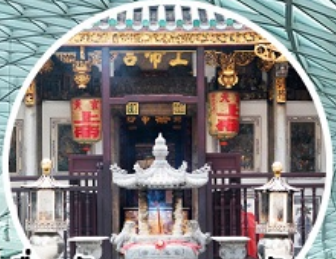
บู เรื่องรัก ขอบรรณครว ขอลูก Yueh Hai Ching Temple

ทัวร์สิงคโปร์ 3วัน 2คืน โดยสายการบิน Thai Lion Air (SL)