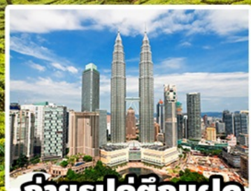
ถ่ายรูปคู่ตึกแฝด