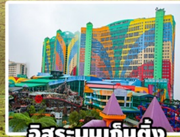
อิสระบนเก็นติ้ง