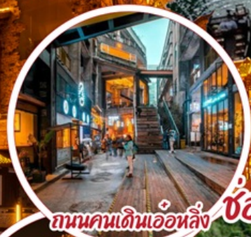
ถนนคนเดินเอ๋อหลิ่ง