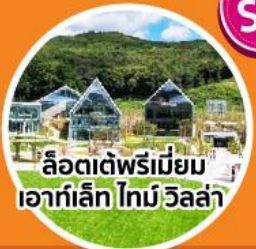
ลีดเตด์พรีเมียม เอาท์เล็ท ไทมี วิลล่า