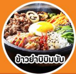
ข้าวยำบีบีမ်พิบ