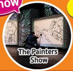
The Painters Show