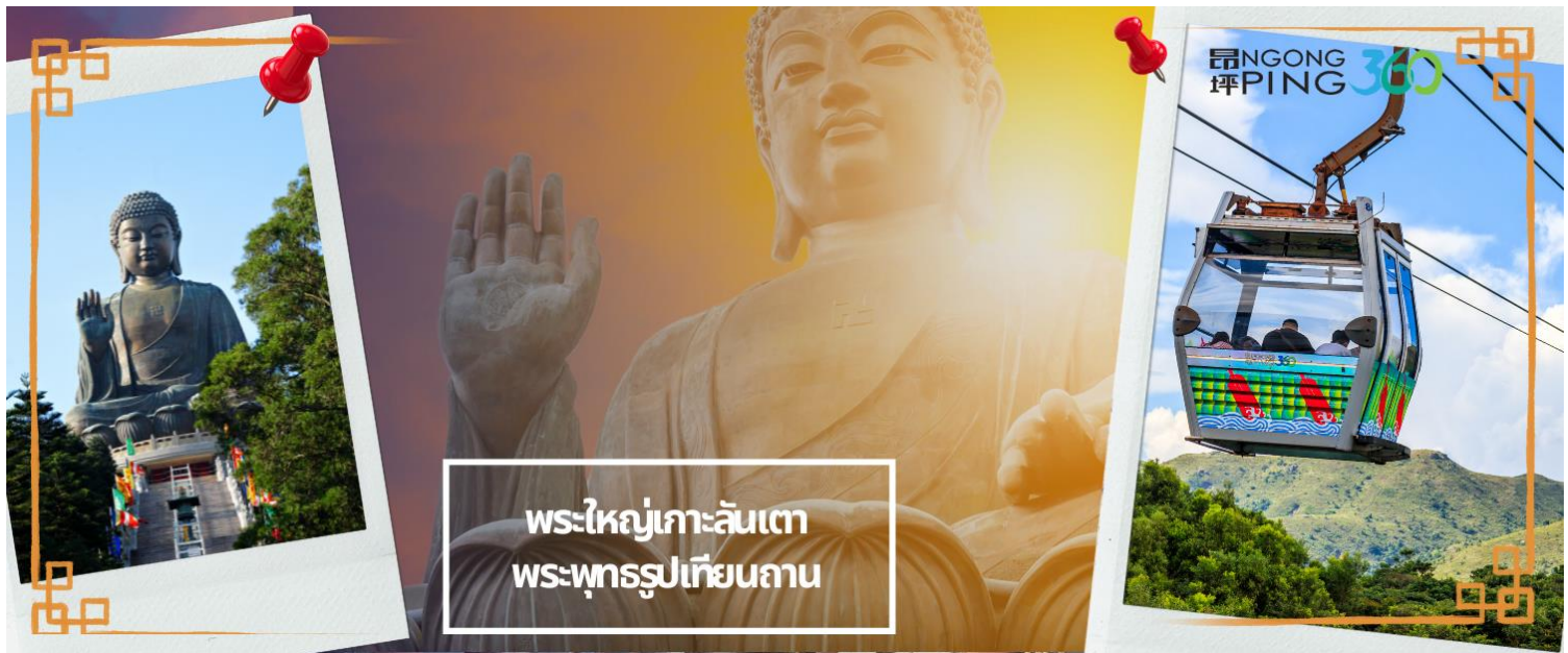
พระใหญ่เกาะลันเตา พระพุทธรูปเทียนถาน

จากนั้นเดินทางสู่เกาะลันเตา เพื่อไปที่สถานีตุงซุง ท่านจะได้สัมผัสกับประสบการณ์ที่น่าตื่นตาตื่นใจจาก กระเช้าลอยฟ้า นงปิง (NGONG PING SKYRAIL 360 **STANDARD CABIN**) ซึ่งถือได้ว่าเป็นแหล่งท่องเที่ยวอันมีเอกลักษณ์ระดับโลกของฮ่องกง ที่มีระยะทางกว่า 5.7 กิโลเมตร ใช้เวลาประมาณ 25 นาที ท่านจะได้สัมผัสบรรยากาศจากบนกระเช้ามุมสูง เส้นทางกระเช้าเชื่อมจากใจกลางเมืองตุงซุง ถึง หมู่บ้านวัฒนธรรมนงปิง บนเกาะลันเตา ท่านจะได้ชมวิวแบบพาโนรามา 360 องศา ของสนามบินนานาชาติฮ่องกง ทิวทัศน์เหนือท้องทะเลของทะเลจีนใต้ ชมวิวของเนินเขาอันเขียวขจี น้ำตก ลำธาร และป่าอันเขียวชอุ่มของอุทยานบนเกาะลันเตาเหนือ (**กรณีกระเช้านงปิง 360 มีการปิดซ่อมบำรุง หรือ มีการปิดเนื่องจากสภาพอากาศแปรปรวน ทางบริษัทฯ ขอสงวนสิทธิ์ในการเปลี่ยนเป็นใช้รถโค้ชของทางอุทยานในการเดินทาง เพื่อนำท่านขึ้นสู่หมู่บ้านวัฒนธรรมนงปิง บนเกาะลันเตาแทน**) จากนั้นนำท่านไปสักการะ พระใหญ่เกาะลันเตา หรือ พระพุทธรูปเทียนถาน (TIAN TAN BUDDHA STATUE) ที่ตั้งตระหง่านอยู่บริเวณริมหน้าผา เป็นพระพุทธรูปทองสัมฤทธิ์กลางแจ้งที่ใหญ่ที่สุดในโลก องค์พระทำขึ้นจากการเชื่อมแผ่นทองสัมฤทธิ์กว่า 200 แผ่น เข้าด้วยกัน น้ำหนักรวม 250 ตัน และสูง 34 เมตร หันพระพักตร์ไปทางด้านทะเลจีนใต้ และมองอย่างสงบลงมายังหุบเขาและโขดหินเบื้องล่างซึ่ง และเชิญท่านอิสระตามอัธยาศัย ลิ้มลองความอร่อยของ อาหารจีนต้นตำรับเมนู อาหารตะวันตก ชั้นเลิศ หรือจะนั่งจิบกาแฟเอ็กซ์เพรสโซอันหอมกรุ่น จากร้านอาหารและร้านค้ำคาเฟ่ในหมู่บ้านนงปิง หรือบางท่านอาจจะเลือกซื้อของขวัญของที่ระลึกจากหมู่บ้านนงปิง อาทิเช่น หยก ไข่มุก หรือเครื่องประดับคริสตัล เพื่อเป็นของที่ระลึก จากนั้นนั่งกระเช้ากลับลงมายังสถานีตุงซุง