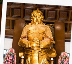
วัดเขกงหมิว