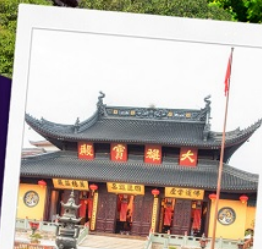
วัดพระหยก