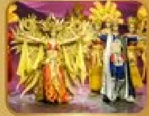
ชมการแสดงโขนจีน