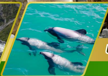
ส่องเรือชมโลมา อ่าวอาคารัว