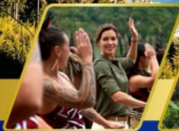
หมู่บ้านเมารี อาหารสโตนโอเวินแบบแองจ์