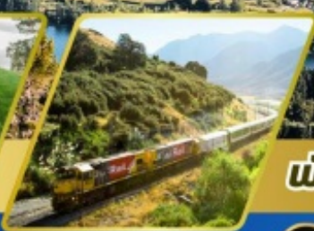
นั้รตไฟฟราหนั อิลไฟน์