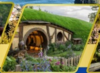
บ้านฮอบบิต อาหารแบบ BBQ