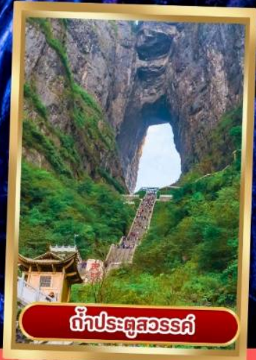
กำแพงประตูสวรรค์

เช็คอินไฮไลท์สุดฮิต น้ำหนักกระเป๋า 20 Kg พักโรงแรม 4 ดาว