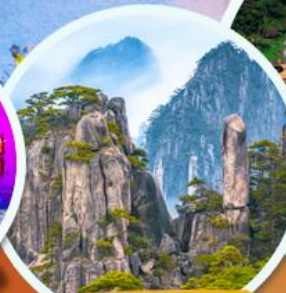
ภูเขาหลวงซาน