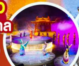
ชมโชว์อลังการ