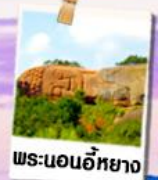
พระนอนอภัยาง