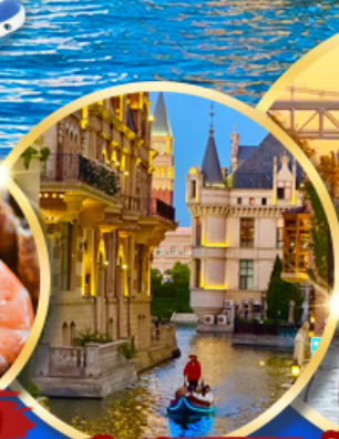
เมืองน้ำเวนิส