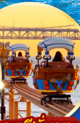
แถมฟรีนั่งรถราง